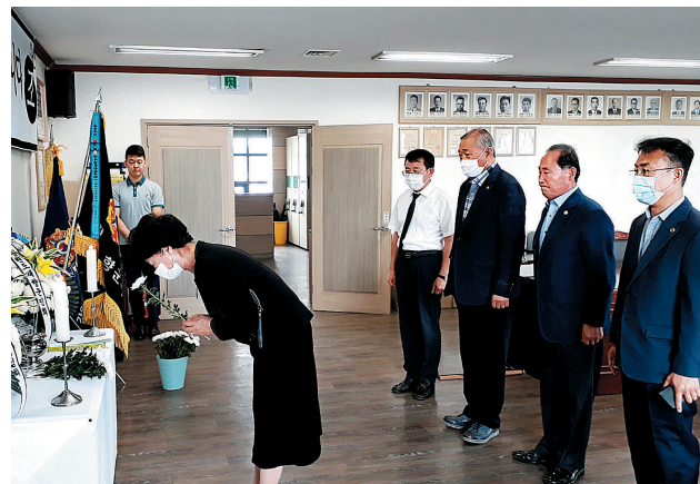
강원도 향군은 7월13일, 14일 군 구회와 통합으로 향군회관에 호국영웅 고 백선엽 장군 추도 분향소를 설치하여 고인의 명복을 빌었다. 분향소에는 향군 임직원 및 회원, 안보 보훈단체장, 각급 기관장, 일반시민 등의 발길이 이어졌다.