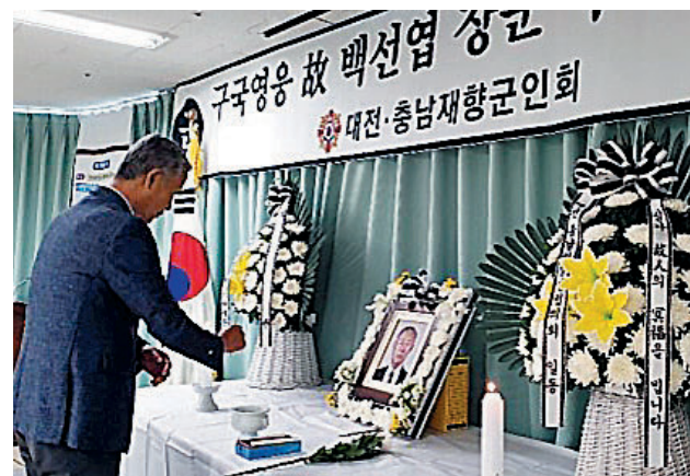
대전 충남 향군은 7월13일, 14일 향군회관 4층 강당에 '구국영웅 고 백선엽 장군 추도 분향소'를 설치하고 장군의 위훈을 기렸다. 분향소에는 향군 임직원 및 회원 등과 보훈단체 회원, 일반시민들의 헌화 분향이 이어져 호국영웅을 추모했다.