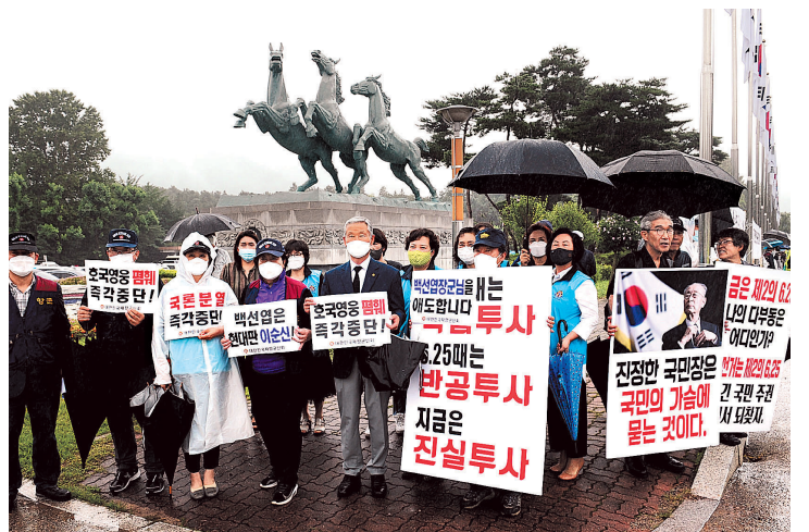
향군은 7월15일 고 백선엽장군의 안장식이 열린 대전국립현충원 앞에서 안장반대 단체에 맞서 맞불집회를 가졌다.

대 현수막도 내걸고 안장을 방해하는 데 대해 분노하며 “구국의 영웅 백선엽 장군님의 명복을 빕니다” “6.25전쟁 영웅 현충원 반대가 웬 말이냐!”라고 적힌 현수막과 추모 피켓을 들고 항의하는 한편 원만한 안장식 진행을 위해 측면 지원했다.