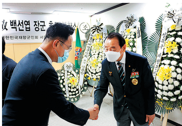
서울시 향군은 7월13일, 14일 구 향군과 통합하여 향군회관에 추모 분향소를 설치하고 6.25 전쟁영웅 고 백선엽 장군을 추모했다. 분향소에는 향군 임직원 및 회원, 호국 보훈단체 회장 및 회원, 일반시민 등 780여명이 추모열기를 이어갔다.