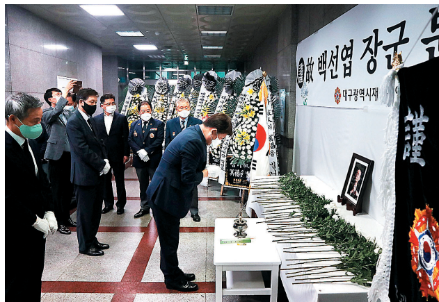
대구시 향군은 7월13일, 14일 향군회관에 고 백선엽 장군 추모 분향소를 설치하여 고인을 추모했다. 8개 구 군회도 자체적으로 고인의 분향소를 설치하여 시민들의 조문을 받았다. 분향소에는 권영진 대구시장 시민 등이 참배행렬에 동참했다.