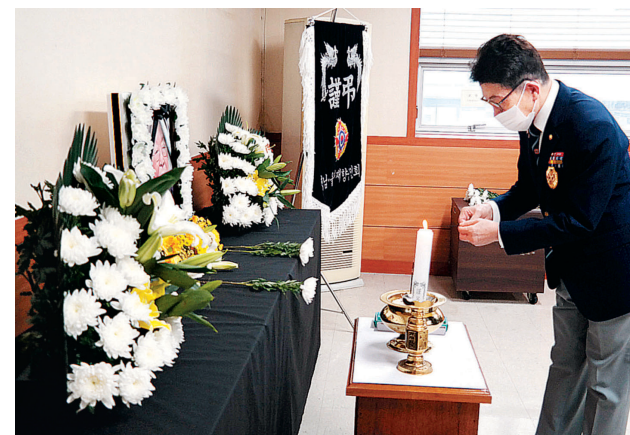
경남 울산 향군은 7월13일, 14일 향군회관에 분향소를 설치하여 6.25 전쟁영웅 고 백선엽 장군을 추모했다. 장군의 정신을 기리고 기억하기 위해 마련된 분향소에는 향군 임직원 및 회원, 보훈단체, 각급 기관장, 시민들이 찾아 추모 열기를 이어갔다.