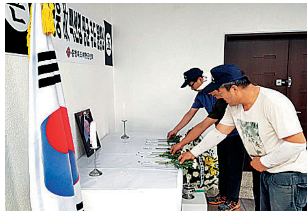
충청북도 향군은 7월13일, 14일 양일간 향군회관내에 고 백선엽 장군 추도 분향소를 마련, 장군을 추모하고 업적과 위훈을 기렸다. 분향소에는 향군 임직원과 회원뿐만 아니라 안보보훈단체 회원, 일반시민 등이 참배행렬에 동참했다.