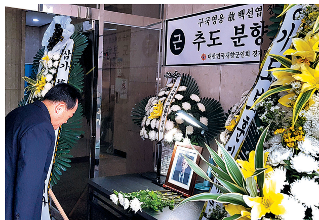
경기도 향군은 7월13일부터 14일까지 향군회관 1층에 구국영웅 백선엽 장군 추도 분향소를 설치하고, 향군 임·직원 및 회원과 보훈안보단체 회원, 일반시민들의 헌화와 분향을 진행했다. 양주시 향군을 비롯한 8개 시 군에서도 분향소를 설치했다.

향군은 전국 각급회 및 해외지회 별로 분향소를 운영하며 한국전쟁 영웅 고 백선엽 장군을 추모했다. 7월 12일부터 13일까지 13개 시 도와 55개 시 군 구회, 7개 해외지회 등 총 75개소에서 분향소를 마련, 고 백선엽 장군의 애국정신을 기리고 마지막 길을 배웅했다. 특히 폭우에도 불구하고 분향소를 설치하여 백 장군의 마지막을 함께한 향군은 호국안보단체 향군의 이미지를 국민들의 마음속에 각인시켰다. 이 기간 각지에서 분향소를 찾아 참배한 인원은 15,000여명에 달했다. <편집자 주>