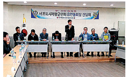
제주도 향군은 제주시 건입동 신축예정부지 마련, 회관건립을 추진하고 있다.