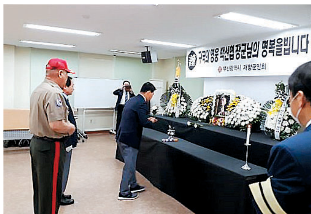
부산시 향군은 7월13일, 14일 향군회관에 백선엽 장군 추모 분향소를 설치하고 장군을 추모하고 위훈을 기렸다. 분향소에는 각급 기관단체장 및 안보 보훈단체장과 회원 그리고 향군 임직원 및 일반시민들의 추모 발길이 이어졌다.