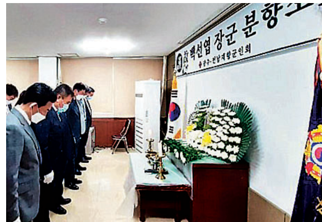
광주 전남 향군은 7월13일, 14일 안보회관에 고 백선엽 장군 분향소를 마련해 헌화, 분향하고 고인의 명복을 빌었다. 또한 한·미 시군구 3곳에도 분향소를 마련 고인을 추모했다. 분향소에는 향군 임직원 및 회원, 보훈단체, 일반시민들의 발길이 이어졌다.