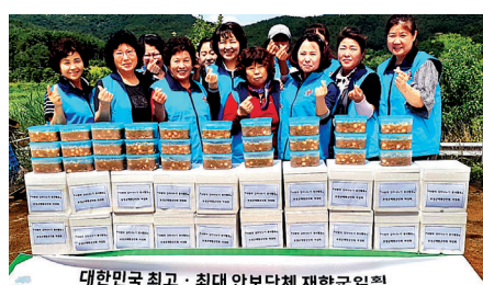
대한민국 최고 · 최대 안보단체 재향군인회