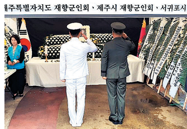
제주특별자치도 재향군인회·제주시 재향군인회·서귀포시 재향군인회는 7월13일, 14일 호국의 별이 된 백선엽을 추모하기 위해 제주시청 어울림 마당에 분향소를 마련, 백장군을 추도했다. 분향소에는 제주도 향군 임직원 및 회원, 각급 기관단체장, 호국보훈단체, 시민 등 650여명의 참배객이 방문했다.