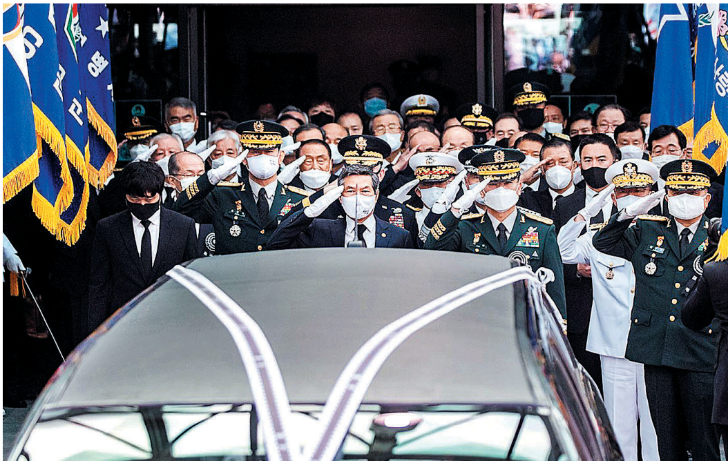
한 뒤 “이렇게 국민 모두가 존경하고 추앙받아야 할 분을 일제강점기의 일본군 경력만을 이유로 매도하고 폄하하는 것은 군의 정통성을 부정하는 것이며 국군을 모욕하는 것”이라고 강조했다.

이어 “문재인 대통령도 조화를 보내 조의를 표하고 국방부장관이 직접 조문을 하며 애도의 뜻을 표했지만 대통령의 국가안보에 대한 국정철학을 뒷받침해야 할 집권여당이 백선엽 장군의 조문과 국립묘지 안장을 놓고 논란이 벌어지고 있는데도 입장이나 논평 한마디 없이 전쟁영웅의 마지막 가는 길을 외면하고 있는데 대해 통탄하지 않을 수 없다”고 비판했다.