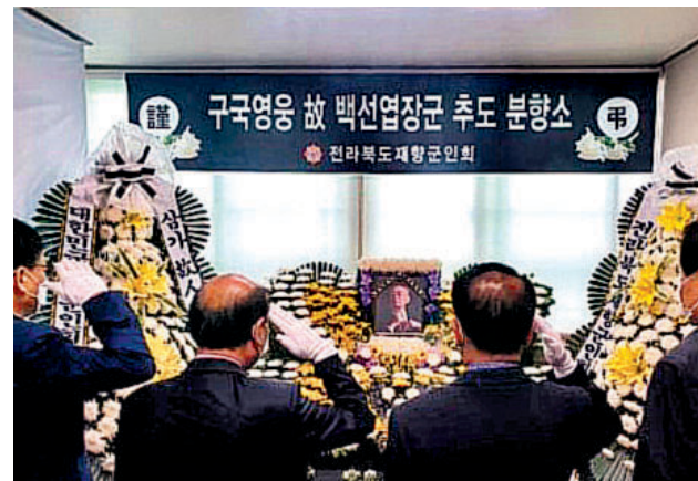
전라북도 향군은 7월12일부터 14일까지 고 백선엽 장군의 분향소를 설치·운영했다. 도회를 비롯해 14개 시·군에 마련된 고 백선엽 장군의 분향소에는 각급 기관장, 보훈단체장, 향군 임직원 및 회원 등 사흘간 약 3천200여 명의 추모객이 다녀갔다.