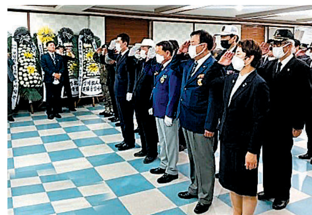
경상북도 향군은 7월13일, 14일 포항시 향군회관에 분향소를 설치해 구국의 영웅으로 칭송받는 고 백선엽 장군을 추모했다. 분향소에는 백선엽 장군의 위훈을 기리는 각급 기관장, 향군 임직원 및 회원, 보훈단체, 일반시민들의 발길이 꾸준히 이어졌다.