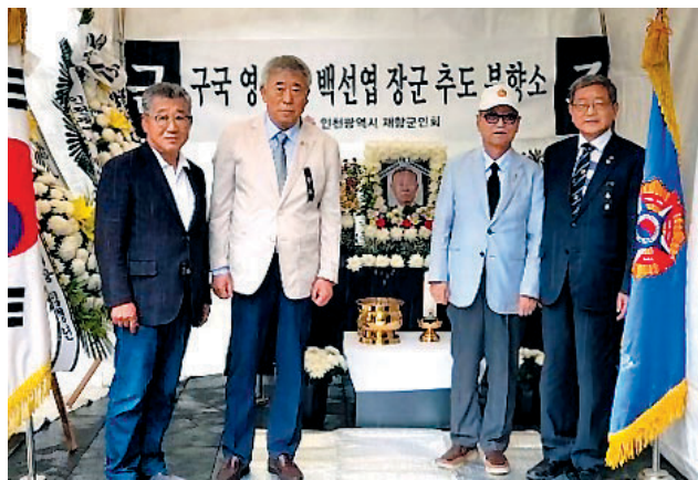
인천시 향군은 7월13일부터 14일까지 향군회관에 추모분향소를 설치하고 6.25전쟁 구국의 영웅인 고 백선엽 장군의 영면을 기원했다. 분향소에는 인천 보훈지청장 등 기관단체장 보훈단체장 및 향군 임직원 및 회원, 시민 등 280여명이 분향소를 방문했다.