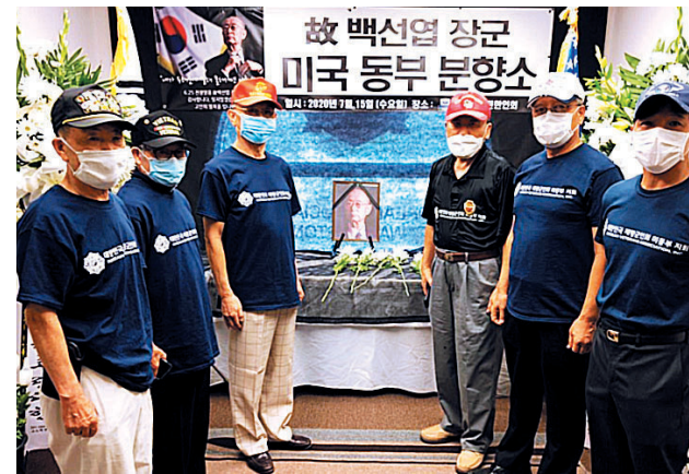
미 동부, 미 중남부, 미 북동부, 미 북중부, 미 북서부, 미 서부, 호주 향군 등 해외지회에서도 각 지역에 추모 분향소를 마련하여 한미동맹의 상징이자 6.25 전쟁영웅 고 백선엽 장군의 명복을 빌었다. 분향소마다 장군의 나라사랑 정신을 기리려는 동포들의 발길이 이어졌다.