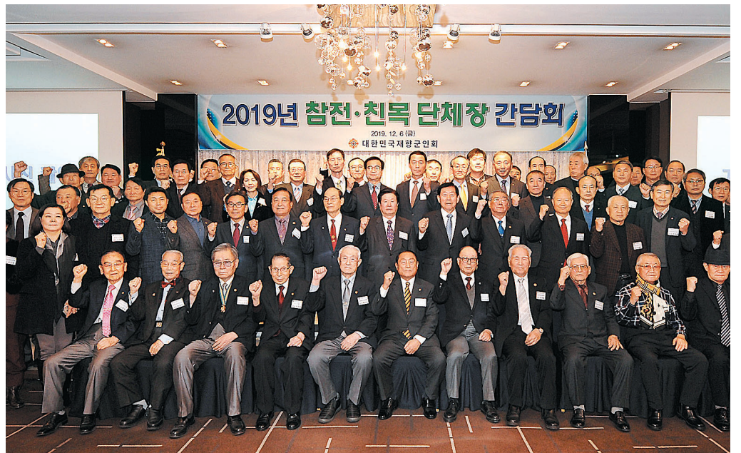
66개 참전·친목단체장들이 안보활동의 적극적인 동참을 다짐하며 화이팅을 외치고 있다.

이날 단체장들은 “향군이 금년 한해 안보단체로서 참 많은 활동을 했다”며 “향군과 함께 나라를 지키고 안보를 바로 세우는 일에 동참하게 되어 매우 보람 있는 한해였다”고 지난 한해를 평가하고 새해에도 안보활동에 적극 참여할 것을 다짐했다.