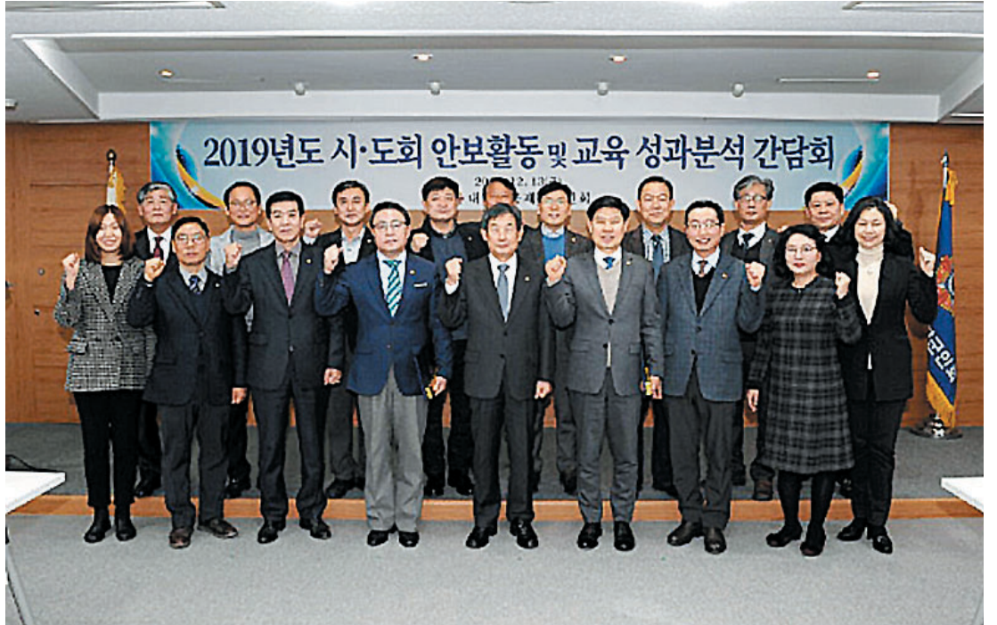
안보활동 및 교육성과 분석회의에 참석한 시·도 안보부장 및 본회 안보관계관들

한편 시·도회 안보부장들은 올 한 해 핵심적으로 추진할 사항들에 대한 정보를 공유하고 소통하며 향군의 위상제고 및 국가안보 지원세력의 구심체 역할을 수행할 것을 다짐했다.