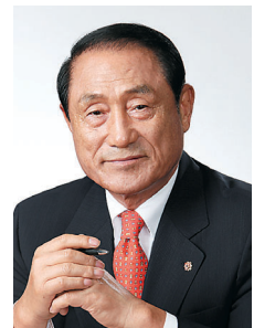
김진호 대한민국재향군인회 회장 (예)육군대장

이를 위한 재원 마련에 다각적인 방안을 강구하고 있으며 국가보훈처와 협조하여